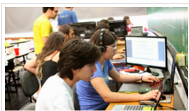
ICMC foi uma das 518 sedes da maratona mundial de criação de games

Publicado em 30/janeiro/2015 | Editoria : Tecnologia | Imprimir | Recommend 75