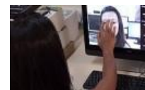
Toques na imagem exibida na tela do simulador permitem experimentar maquiagem sem usar produtos reais