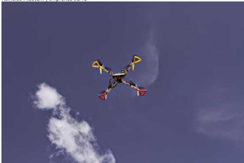
Impressora produziu um drone, peças robóticas e até mesmo outra impressora 3D