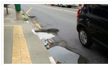
Com o aplicativo, as prefeituras podem responder às demandas da população

Falta de água, alagamentos, calçadas em mau estado, postes queimados, mato alto, buraco no asfalto, lixo e entulho jogados na rua: as reclamações postadas pelos cidadãos na internet parecem não ter fim. Preocupados com a questão, um grupo criou uma plataforma gratuita para que as prefeituras possam responder a mais de 80 tipos de reclamações de moradores de várias cidades tipos de reclamações da população. Um aluno do Instituto de Ciências Matemáticas e de Computação (ICMC) da USP, em São Carlos, e ex-alunos da Universidade Federal de São Carlos (UFSCar) são os responsáveis pela iniciativa.