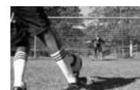
Investimento do governo militar na seleção brasileira possibilitou suporte financeiro para a conquista do cargo