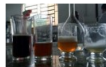
Melado de cana-de-açúcar, permeado de leite e café foram alguns dos produtos testados na composição da bebida