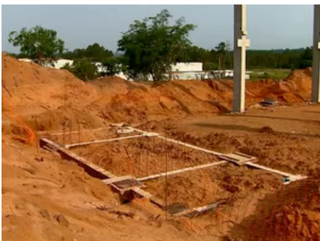
ParTec está ampliando para receber mais 25 empresas