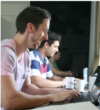
Equipe do Cidadera busca construir pontes entre prefeituras e cidadãos.

Falta de água, alagamentos, calçadas em mau estado, postes queimados, mato alto, buraco no asfalto, lixo e entulho jogados na rua: as reclamações postadas pelos cidadãos na internet parecem não ter fim. Preocupados com a questão, um grupo criou uma plataforma gratuita para que as prefeituras possam responder a mais de oitenta tipos de reclamações da população. Um aluno do Instituto de Ciências Matemáticas e de Computação (ICMC) da USP, em São Carlos, e ex-alunos da UFSCar são os responsáveis pela iniciativa.